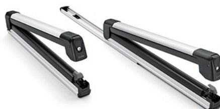
슬라이딩 스키·스노보드 캐리어