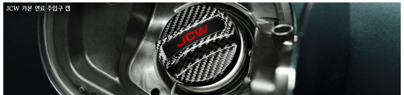
JCW 카본 연료 주입구 캡