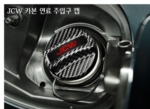
JCW 카본 연료 주입구 캡