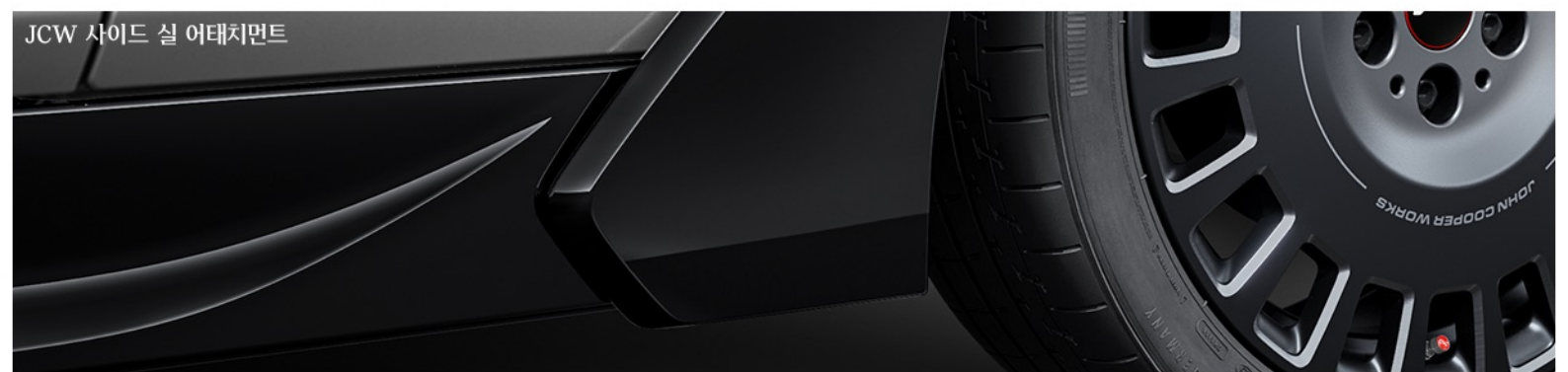
JCW 사이드 실 어태치먼트