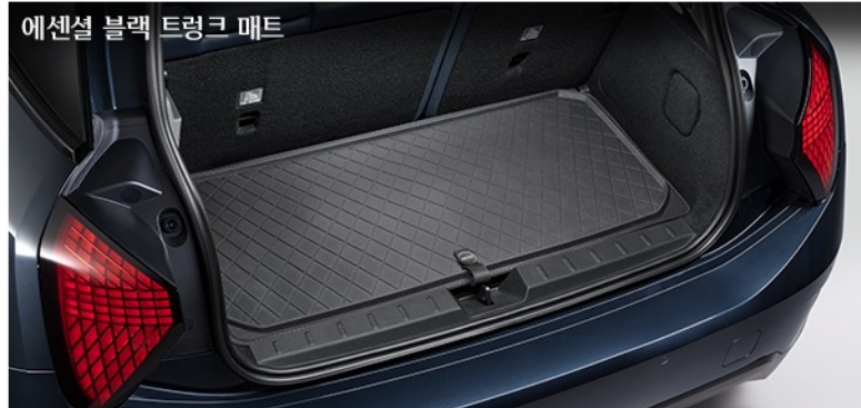
에센셜 블랙 트렁크 매트