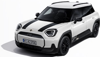
헤리티지 블랙 데칼