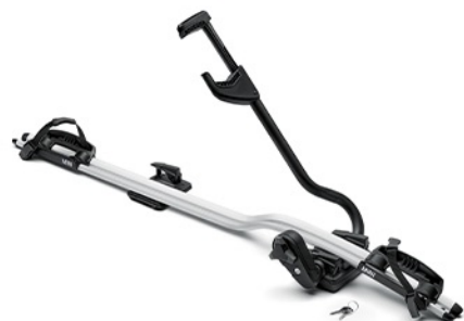
자전거 루프 캐리어