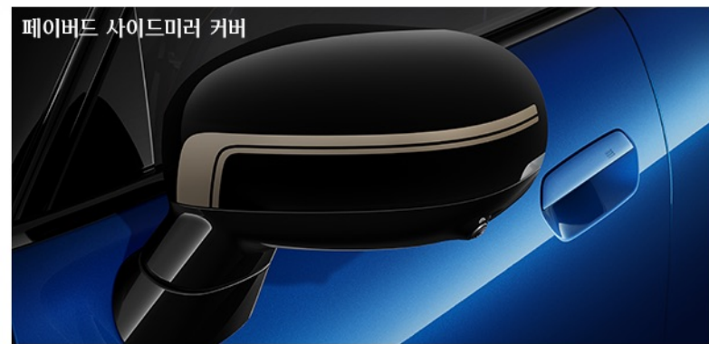
페이버드 사이드미러 커버