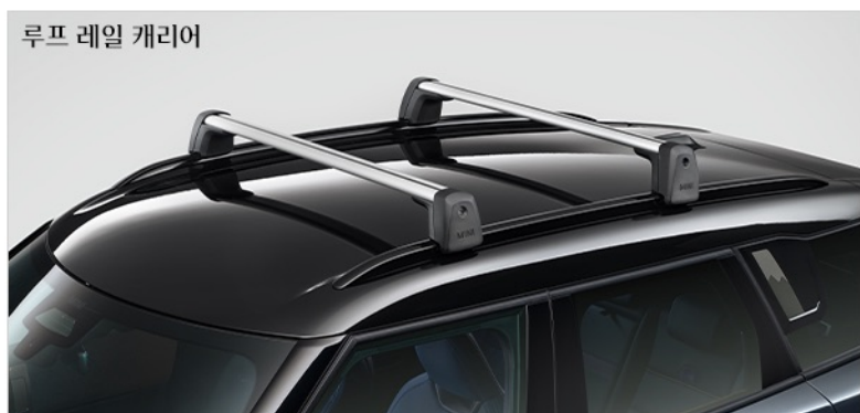
루프 레일 캐리어