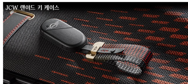
JCW 랜야드 키 케이스