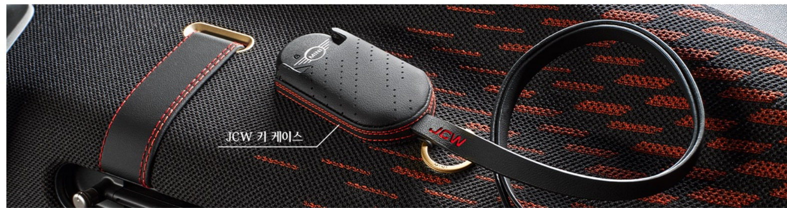
JCW 키 케이스