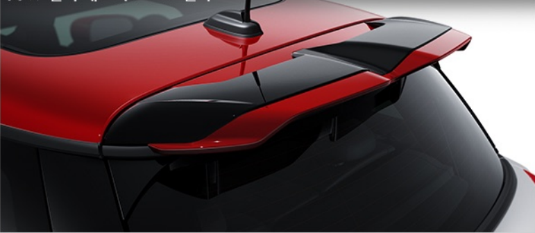
JCW 칠리 레드 루프 스폰일러