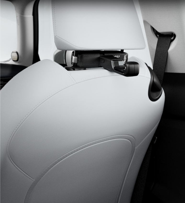
블랙 멀티 후크