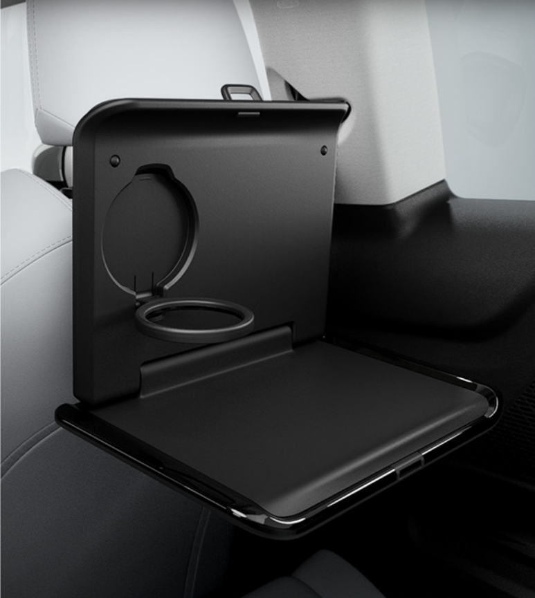
블랙 폴딩 테이블