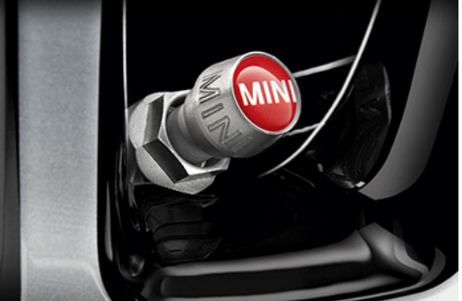
MINI 로고 밸브 캡