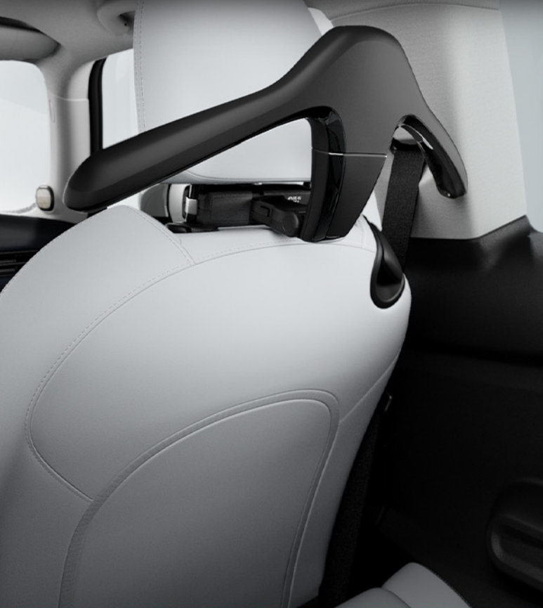
블랙 코트 행거