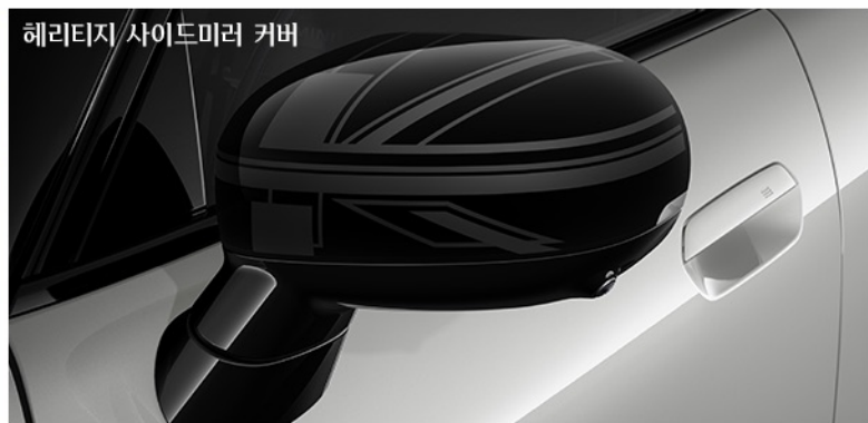
헤리티지 사이드미러 커버