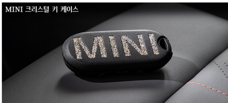
MINI 크리스탈 키 케이스