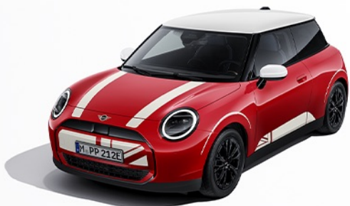
헤리티지 화이트 데칼