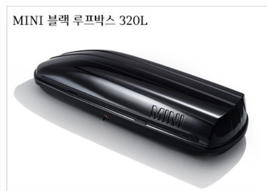
MINI 블랙 루프박스 320L