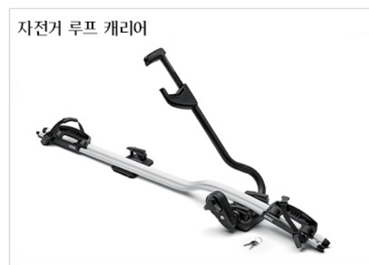
자동 루프 캐리어