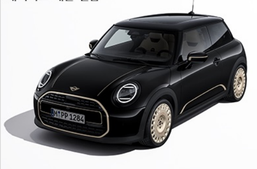
페이버드 데칼 필름