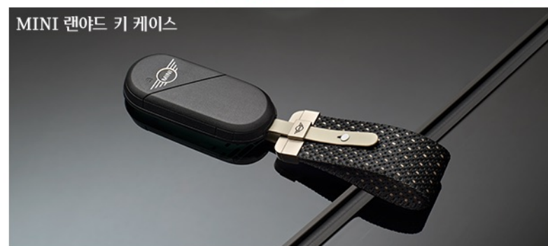
MINI 랜야드 키 케이스