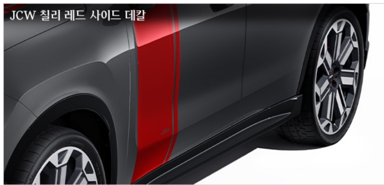
JCW 칠리 레드 사이드 데칼