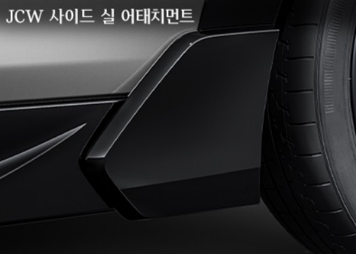
JCW 사이드 실 어태치먼트