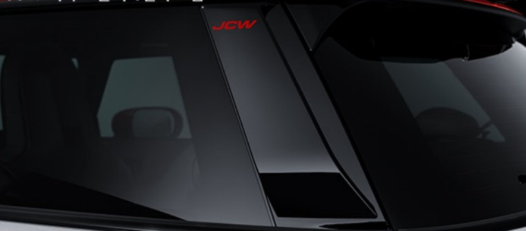
JCW 피아노 블랙 C필러 트림