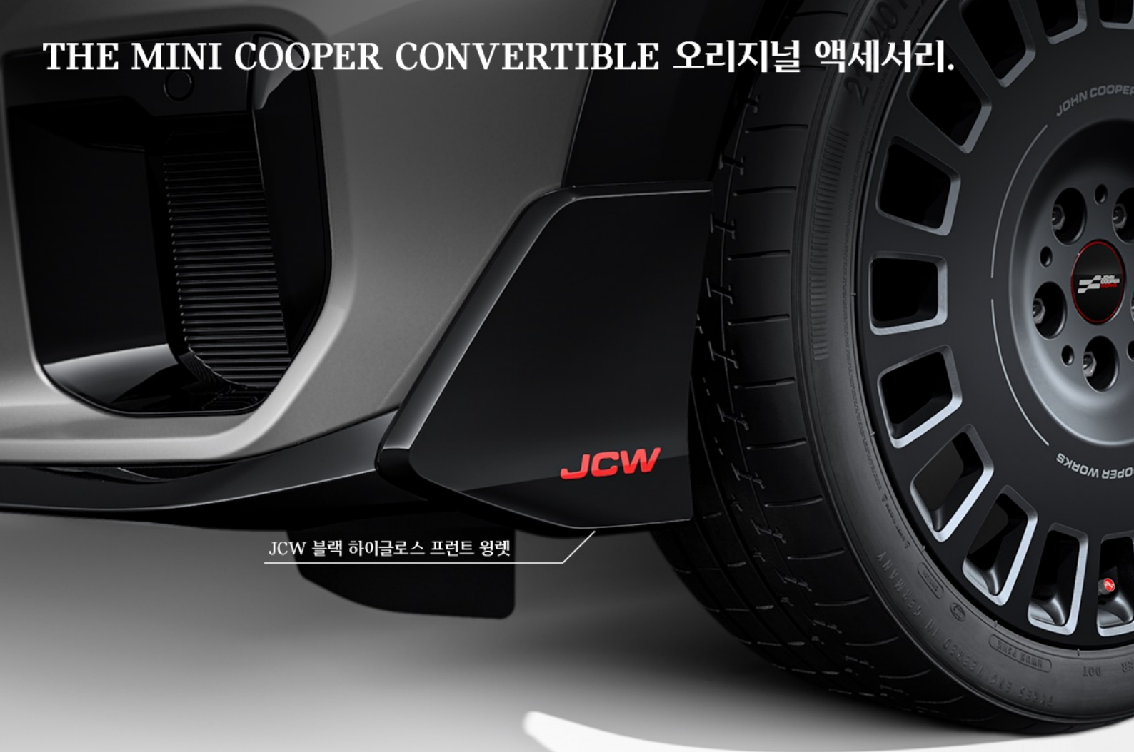
JCW 블랙 하이글로스 프론트 윙렛