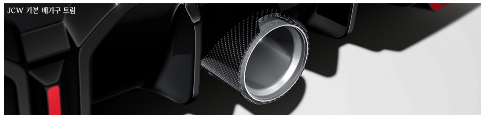
JCW 카본 배기구 트림