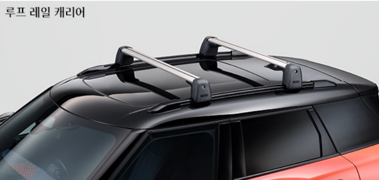
루프 레일 캐리어