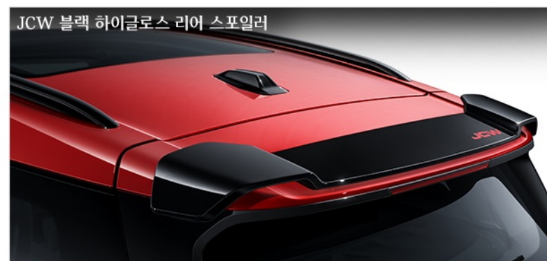
JCW 블랙 하이글로스 리어 스포일러