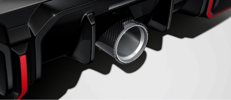
JCW 카본 배기구 트림