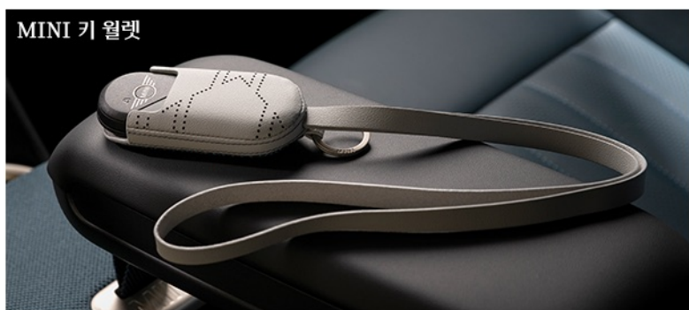
MINI 키 월렛