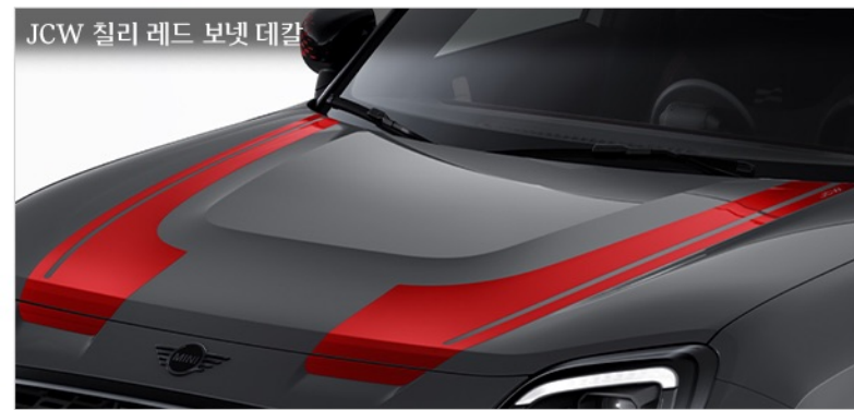
JCW 칠리 레드 보닛 데칼