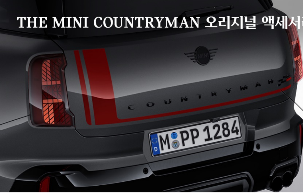
JCW 칠리 레드 트렁크 데칼