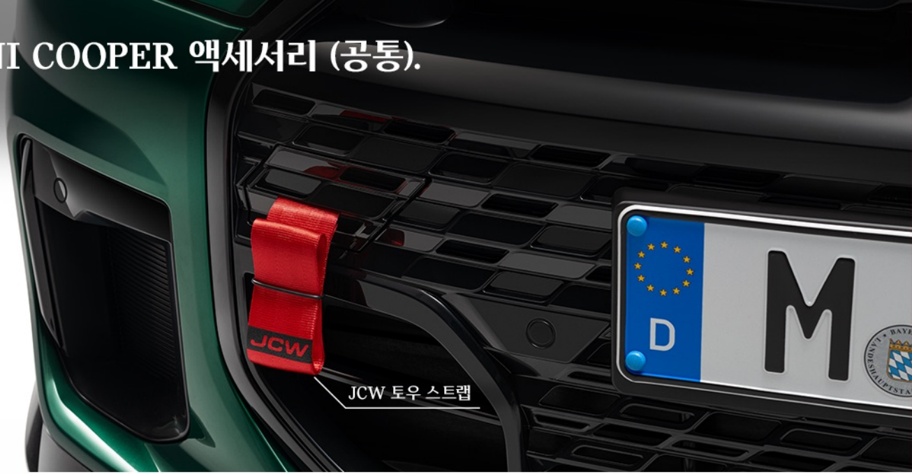
JCW 토우 스트랩