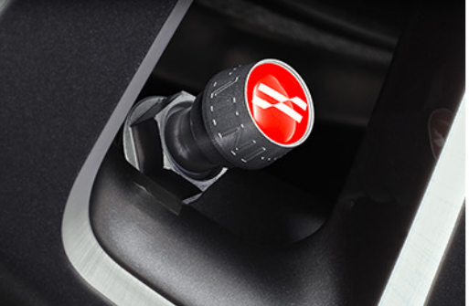
JCW 로고 밸브 캡