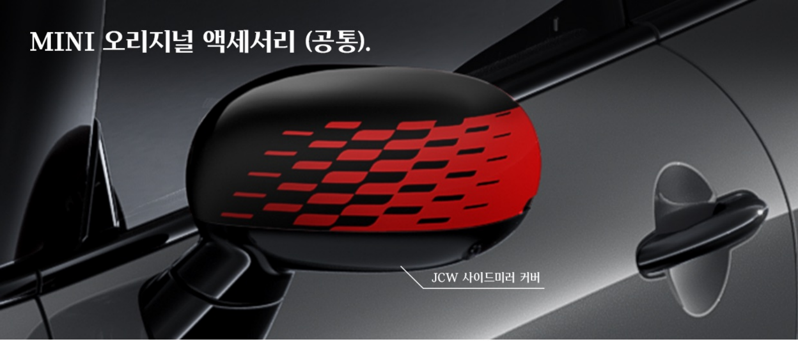
JCW 사이드미러 커버