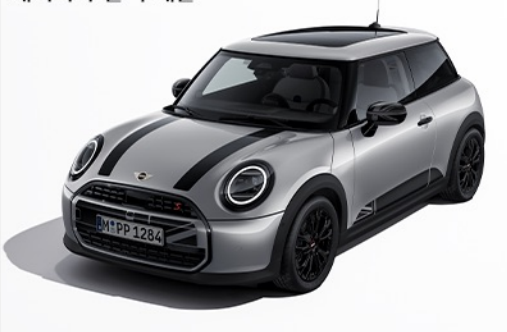
헤리티지 블랙 데칼