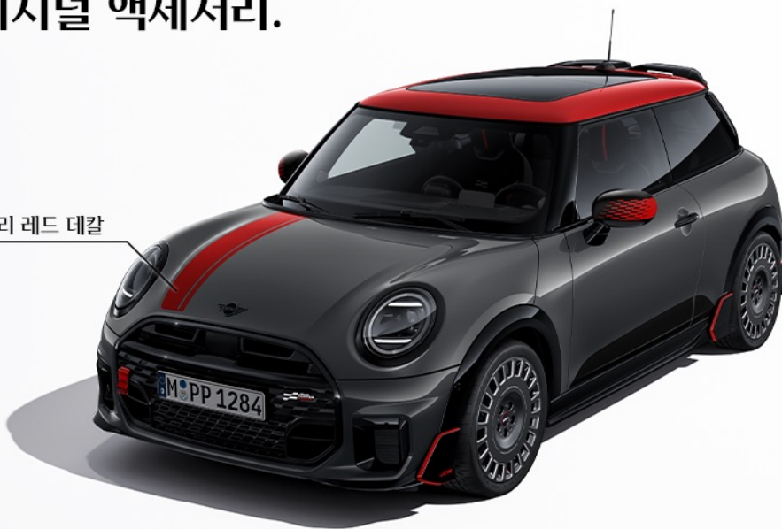
JCW 칠리 레드 데칼