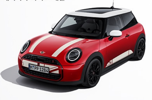
헤리티지 화이트 데칼