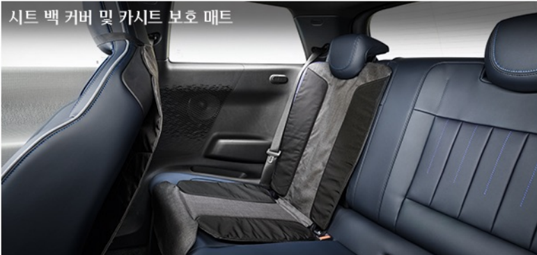
시트 백 커버 및 카시트 보호 매트