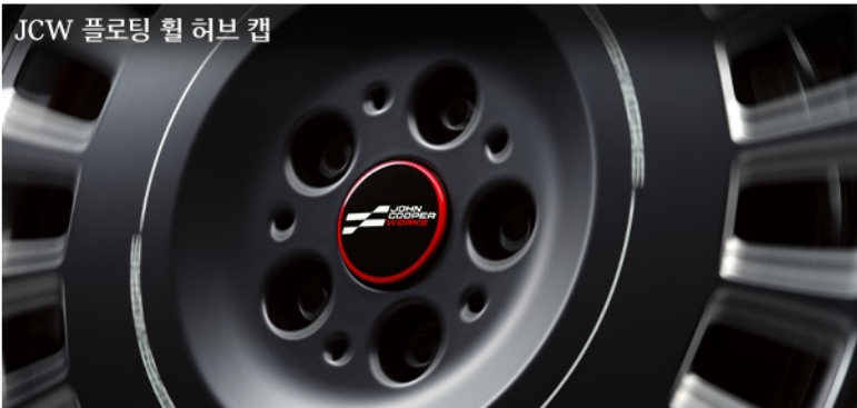
JCW 플로팅 휠 허브 캡