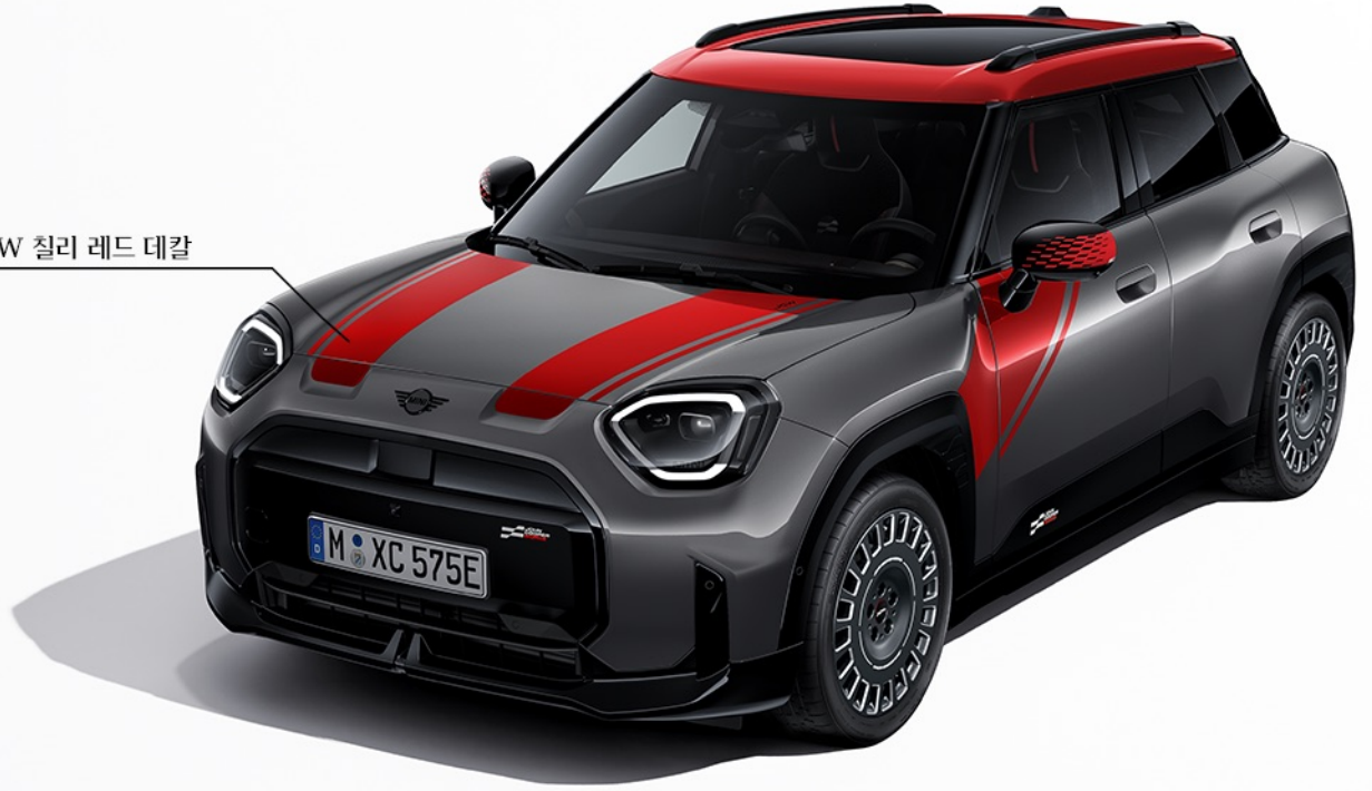
JCW 찰리 레드 데칼