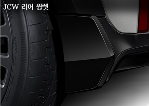
JCW 리어 윈렛