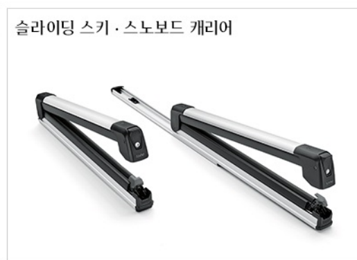
슬라이딩 스키·스노보드 캐리어