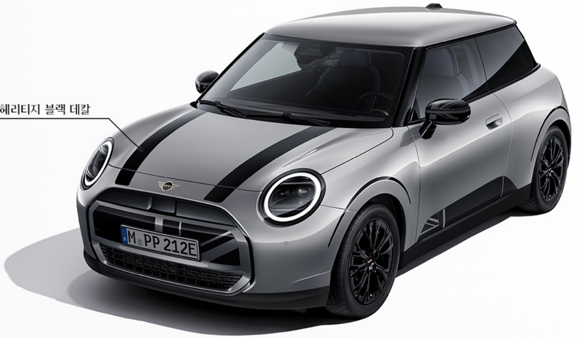
헤리티지 블랙 데칼